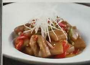
2702 辣魔芋 こんにやくピリ辛煮 Fried Spicy Konjak