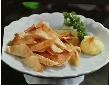
2602 烤老板鱼翅 エイひれ炙り焼き Grilled Ray fin