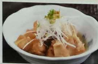
2708 炖牛筋 牛筋の煮込み Boiled beef muscle