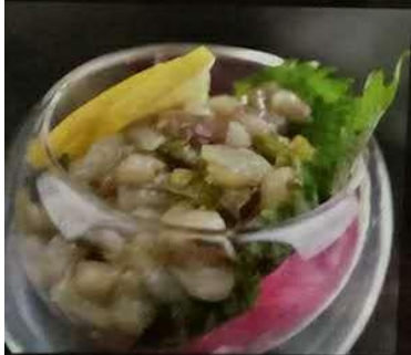
淹芥末章鱼 タコわさび Octopus wasabi