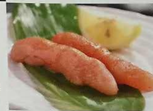
2705 炙明太鱼籽 炙り明太子 Grilled spicy pollack roe