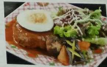
2709 黑毛牛汉堡 黒毛牛のハンバーグ Hamburg steak