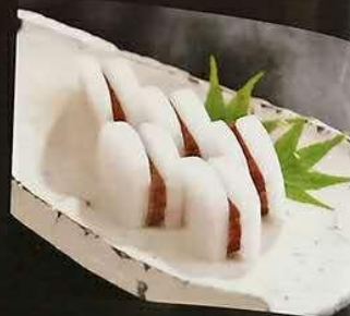
2604 腌乌鱼籽萝卜 からすみ大根 Dried Muller roe