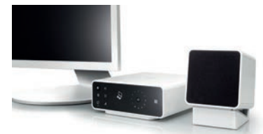
不包括笔记本电脑